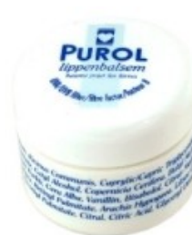
Purol Lippenbalsem Potje