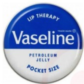
Lip Therapy Original

Bij een hardnekkig eczeem rond de lip kan het nodig zijn om een anti-eczeemzalf met corticosteroïden er in te gebruiken. Deze worden voorgeschreven door de huisarts of door de dermatoloog. Een voorbeeld is hydrocortison zalf. Gebruik dit soort zalven niet te vaak rond de lip, er kunnen bijwerkingen bij optreden. Goed vet houden is belangrijker.