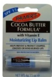
Palmers cocoa butter lipbalm 4 g