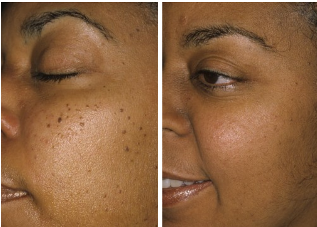
dermatosis papulosa nigra wratjes voor en na behandeling met electrocoagulatie

Omdat de wratten stevig vast zitten aan de huid, is het toch wel nodig om enige vorm van verdoving toe te passen. Soms is koelen met een spuitbusje waarin een hele koude vloeistof zit (chloorethylspray) voldoende. Dit is echter snel weer uitgewerkt. Voor het verwijderen (afschrapen) van grote verruca seborroica is toch een goede, echte verdoving het beste. Hiervoor wordt een klein beetje verdovingsvloeistof (bijvoorbeeld lidocaine) precies onder de wrat gespoten. Daarna kan de wrat, ook hele grote in het gelaat, pijnloos worden verwijderd. Een andere methode, die vooral geschikt is voor dermatosis papulosa nigra, is het aanbrengen van een verdovende crème (EMLA crème). Dit moet een uur voor de behandeling worden aangebracht en afgedekt met plastic huishoudfolie.