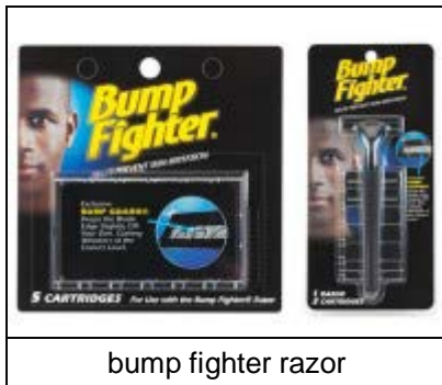
bump fighter razor

Scheermessen: de moderne scheermessen bevatten soms 3-5 messen vlak achter elkaar, en dat kan ook te kort afgeschoren haren veroorzaken. Er bestaan speciale scheermessen voor pseudofolliculitis barbae. Deze bestaan vaak uit maar 1 scheermes, en afstandhouders. Een bekend merk, uit Amerika, is de Bump Fighter. Via het internet kunt u er achter komen waar dit scheermes, of soortgelijke typen scheermessen te koop zijn, of te bestellen via internet.