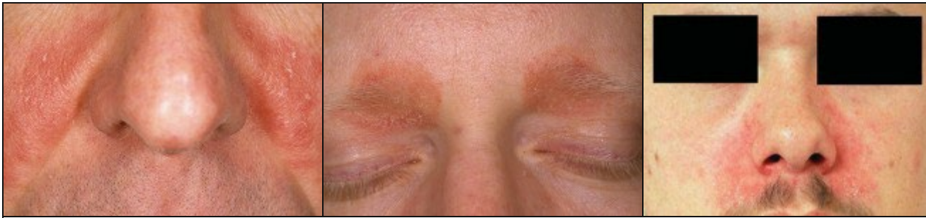
Seborroisch eczeem op de klassieke voorkeursplekken: de plooien naast de neus en de wenkbrauwen.

Seborroisch eczeem is een milde vorm van eczeem waarbij jeuk, roodheid en schilfertjes ontstaan in het gezicht, vooral in de wenkbrauwen en in de plooien naast de neus. Dat zijn de meest voorkomende plekken waar het zit, maar het kan ook achter de oren zitten, of langs de haargrens. Soms is er uitbreiding naar de plooien (navel, onder de borsten, buikplooï, liezen, bilspleet, en rond de anus), en het kan ook rond de wimpers zitten. Er worden verschillende namen gebruikt voor seborroisch eczeem, zoals seborrhoisch eczeem , eczema seborrhoicum , en in het Engels seborrhoic dermatitis of seborrhoic eczema .