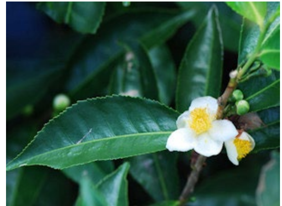
Foto groene thee plant: Pancrat - Wikimedia (Creative Commons License 1.0 - Public Domain Image)